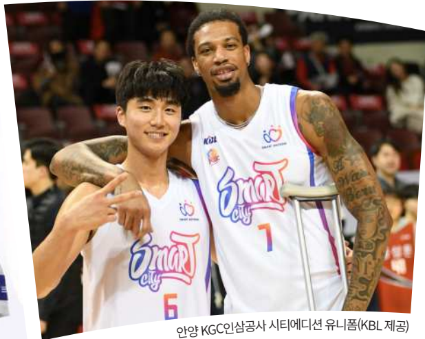
안양 KGC인삼공사 시티에디션 유니폼