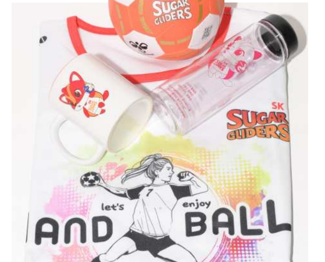
핸드볼 SK슈가글라이더즈 굿즈

핸드볼이 겨울 3대 인기스포츠가 되기 위해서는 팬들의 이목을 집중시킬 그 무언가를 찾아야 한다. 최근 그중 하나로 굿즈 상품이 떠오르고 있다. 구단은 굿즈 상품을 통해 이익 및 구단의 이미지 상승을 꾀할 수 있다. 굿즈 상품 출시의 선택이 아니라 필수인 시대가 된 셈이다. 🌐