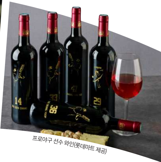
프로야구 선수 와인