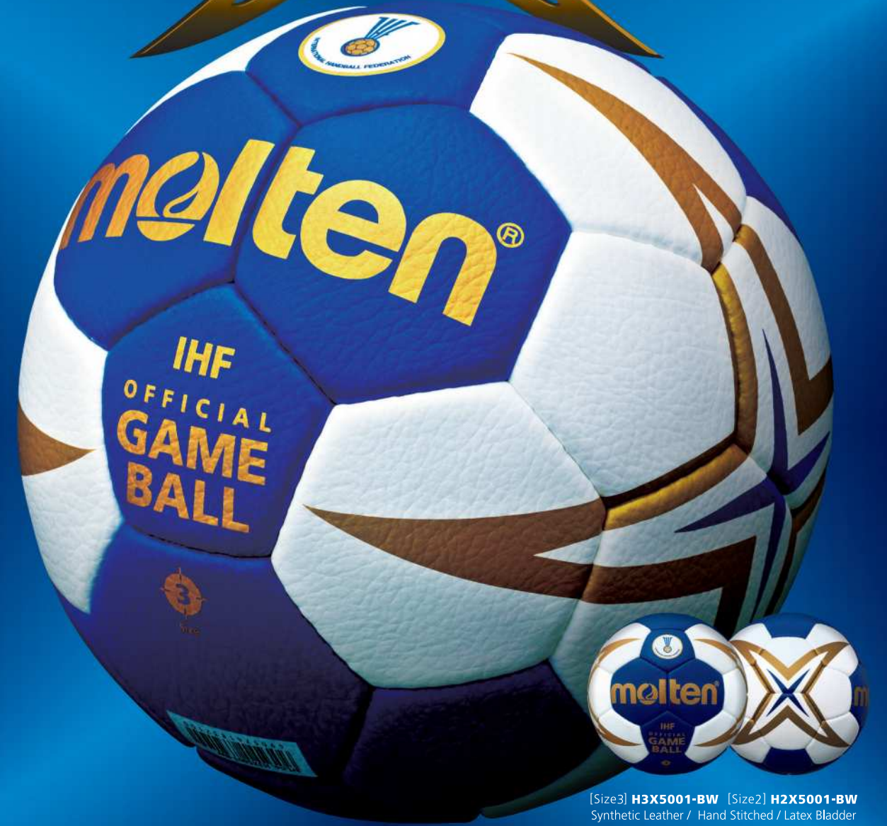
[Size3] H3X5001-BW [Size2] H2X5001-BW Synthetic Leather / Hand Stitched / Latex Bladder