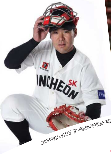
SK와이번스 인천군 유니폼