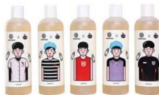
프로야구 KT 위즈 콜라보 삼푸, 향수

지난 2015년 프로야구는 CU, 최훈 카툰작가와 손을 잡았다. 각 구단의 마스코트가 그려진 교통카드를 출시한 것. 고가는 아니지만, 팬들과 가장 쉽게 접촉할 수 있는 길을 찾은 셈이다. 당시 야구팬들은 이에 대한 반응이 뜨거웠고, 현재는 판매되지 않는 상태에 종종 중고거래로 니즈를 이어가는 경우도 있다. 프로야구는 1년 후 사상 첫 800만 관중 돌파를 앞두고 또 한 번 이색적인 콜라보레이션을 이뤄냈다.